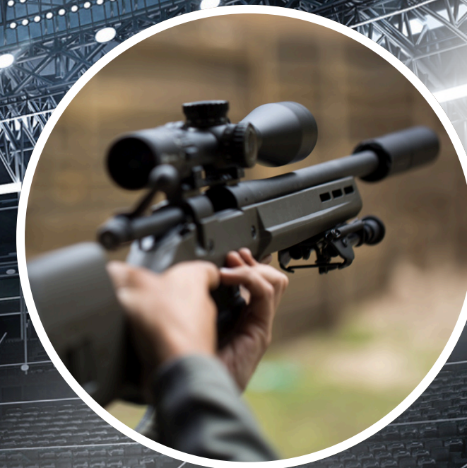
JUEGO DE TIRO