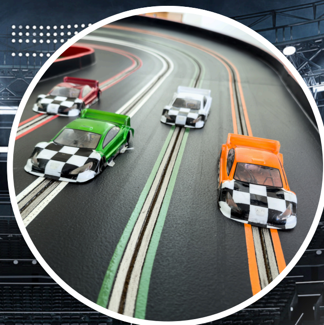
JUEGO DE CARRERAS